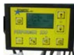
COMPUTER DI BORDO ON BOARD COMPUTER